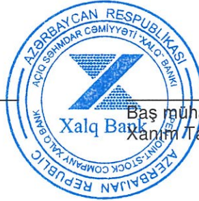
Baş mühasib Xanım Tamilla Əsədova